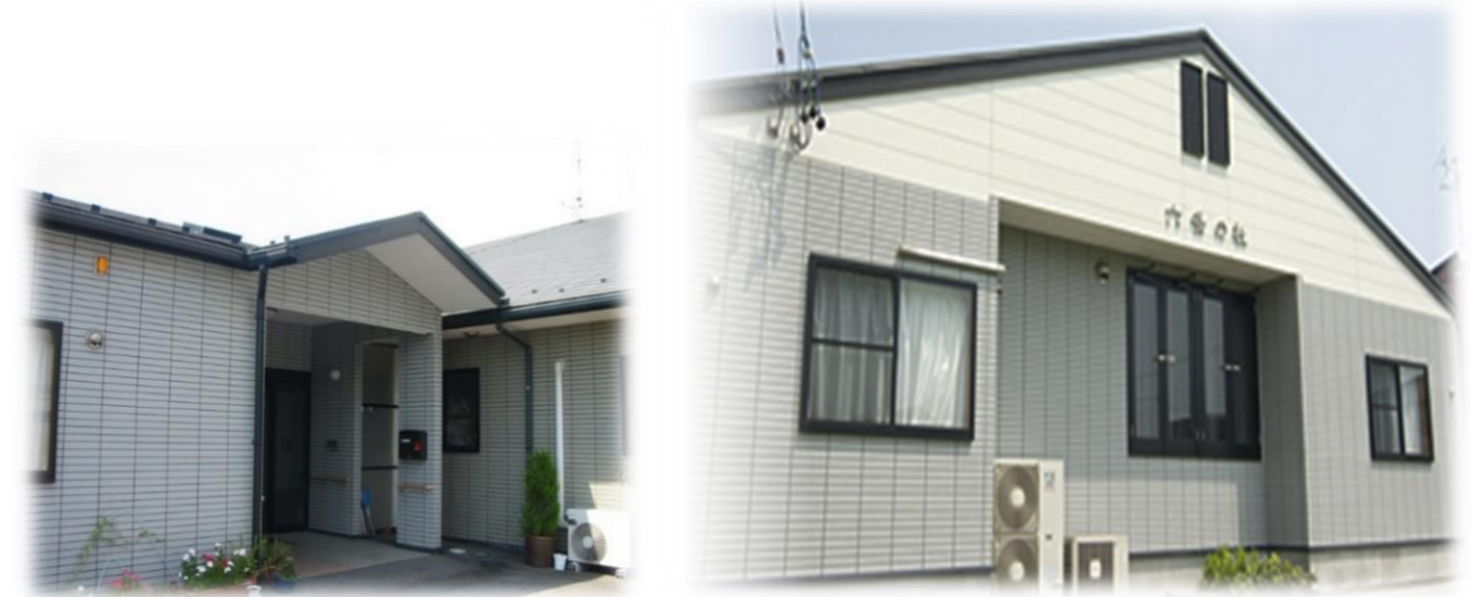
グループホーム六条の杜 共用型認知症デイサービス 外観